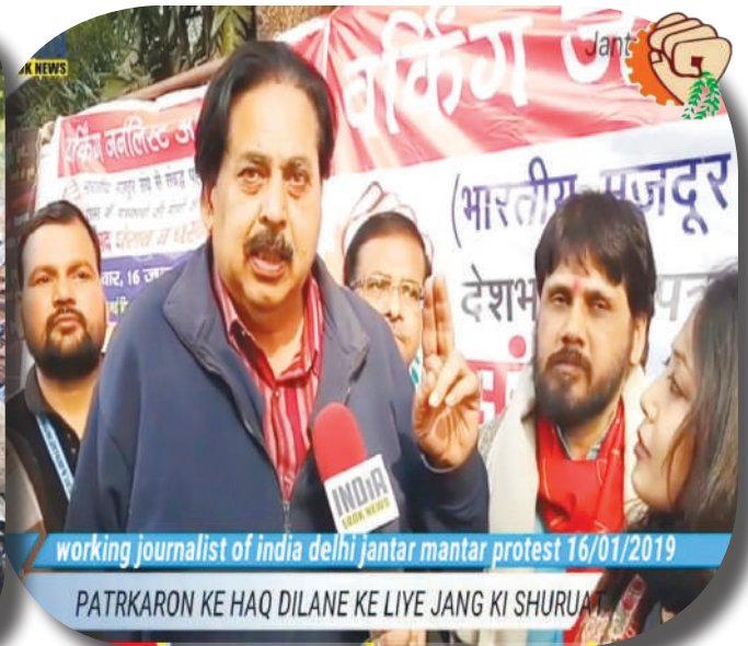
working journalist of india delhi jantar mantar protest 16/01/2019

PATRKARON KE HAQ DILANE KE LIYE JANG KI SHURUAAT